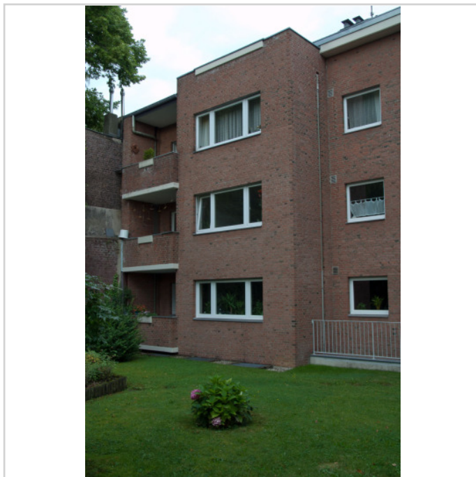
Wohnung im 1.OG